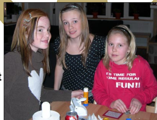
Bild från Tonårsöppet